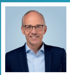
LUC FRIEDEN Premierminister