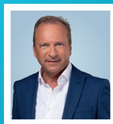
GILLES ROTH Finanzminister