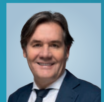
LIES MARC 55, Hesper, Spuerkeessbeamten, Buergermeeschter Bezierk Zentrum