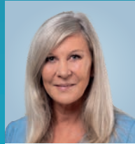
ARENDET ÉP. KEMP NANCY 55, Monnerech, Chargée de cours Bezierk Süden