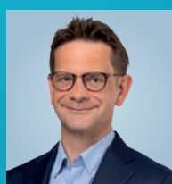
ZEIMET LAURENT 50, Beetebuerg, Affekot, Buergermeeschter Bezierk Süden