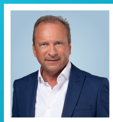
GILLES ROTH Ministre des Finances