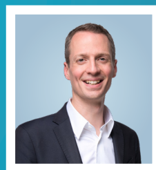
SERGE WILMES Ministre de l'Environnement, du Climat et de la Biodiversité Ministre de la Fonction publique