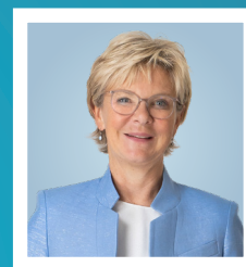
MARTINE HANSEN Ministre de l'Agriculture, de l'Alimentation et de la Viticulture & de la Protection des consommateurs