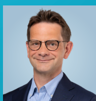
ZEIMET LAURENT 50 ans, Bettembourg, Avocat, Bourgmestre Circonscription Sud