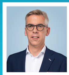
LÉON GLODEN Ministre des Affaires intérieures