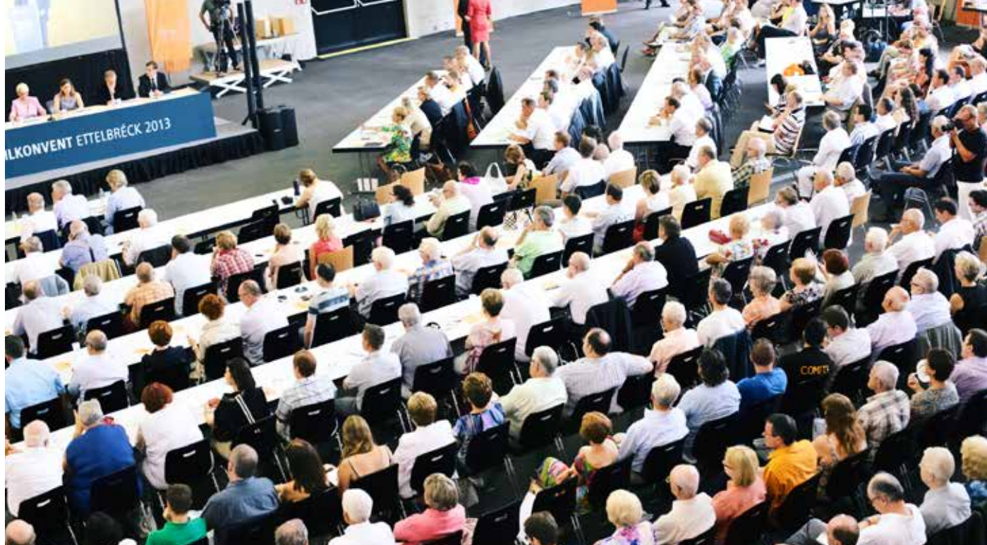
Un parti populaire : S'opposant à la lutte des classes, le CSV se voulait dès le départ un parti de masse.

Le parti de la droite favorisait au début un syndicat unique, mais suite à la création des syndicats dits «libres», il encouragea en 1921 l'avènement du syndicat chrétien LCGB, qui allait appuyer l'aile sociale du parti. La question de savoir si les syndicalistes «de pointe» devaient aussi s'engager dans la politique divisa régulièrement le syndicat. Après l'apothéose électorale de 2009, le LCGB prit par la suite, ses distances sans rompre tout à fait. Cette prise de distance se passa sous l'influence de la crise des initiatives sociales pour l'emploi et de la mutation sur le marché du travail (les salariés de nationalité luxembourgeoise ne représentant guère plus de 30% par rapport aux immigrés avoisinant les 30% et les frontaliers pourvoyant 40% de ce marché du travail).