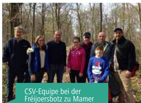
CSV-Equipe bei der Fréijoersbotz zu Mamer