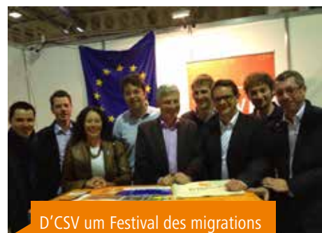
D'CSV um Festival des migrations