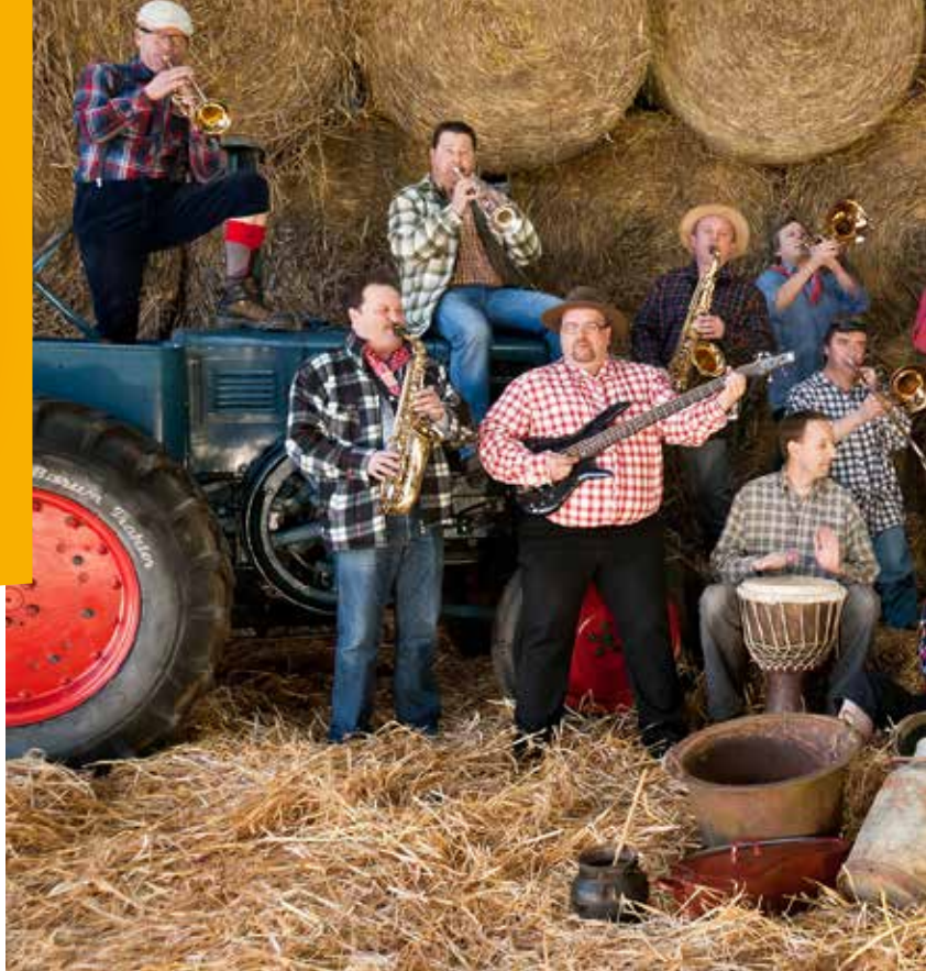
MUSEKALESCHT ENCADREMENT Moselle Valley Brass Band

D'CSV ass eng grouss Vollekspartei. Als klenge Merci fir Ärt Engagement, Ärt Vertrauen an Ären Asaz invitéieren d'CSV-Generalsekretariat an d'Fraktioun Iech an Är ganz Famill op d'Familljefest.