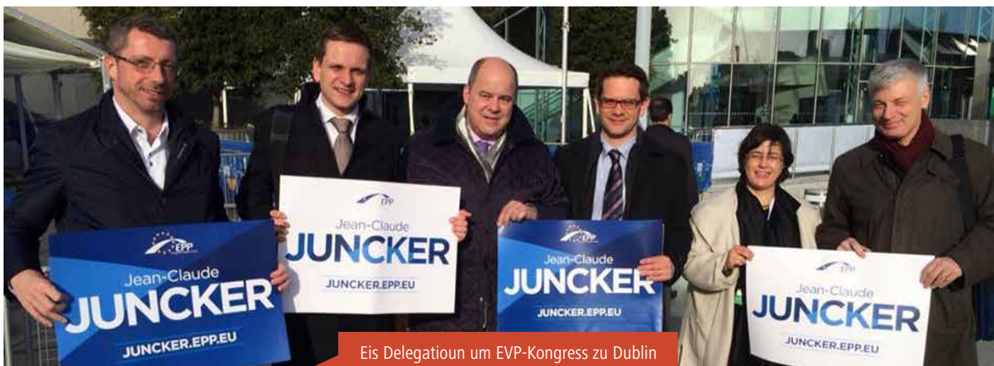
Eis Delegatioun um EVP-Kongress zu Dublin