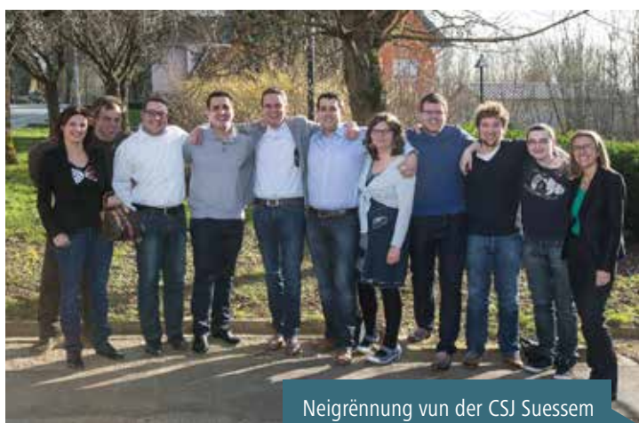
Neigrënnung vun der CSV Suessem