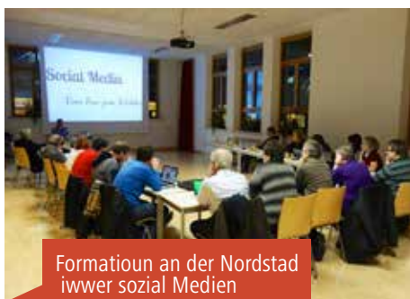
Formatioun an der Nordstad iwwer sozial Medien