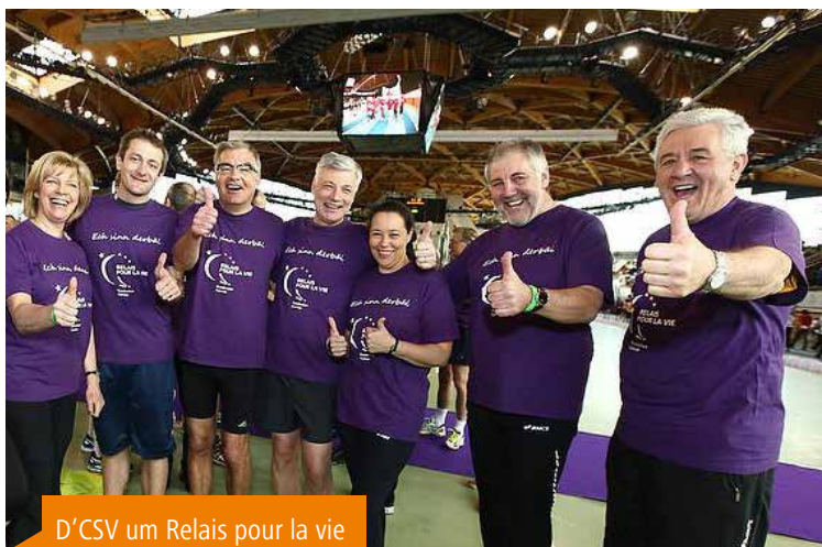
D'CSV um Relais pour la vie