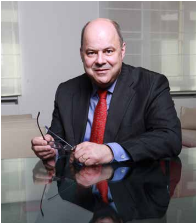
Marc Spautz Präsident

In rund einem Monat werden die Wahlen zum Europaparlament stattfinden. Für unser Land, das Gründungsmitglied der Europäischen Union ist, sind es absolut wichtige Wahlen. Die sechs Vertreter der Bürgerinnen und Bürger unseres Landes im Europaparlament bestimmen über unsere Zukunft in Europa mit. Europa regelt nicht alles, kann und darf auch nicht alles regeln, doch wichtige Weichenstellungen wie in der Finanz- und Wirtschaftspolitik, bei Umwelt- und Klimaschutz, bei der Energieversorgung und in der Aussen- und Sicherheitspolitik werden von Europa mitgestaltet.