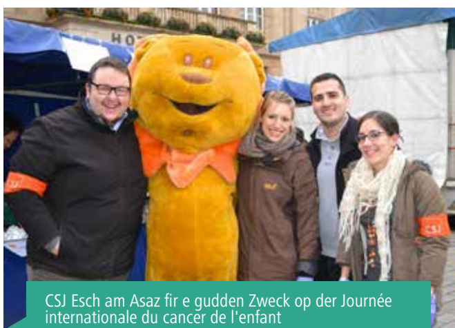
CSV Esch am Asaz fir e gudden Zweck op der Journée internationale du cancer de l'enfant