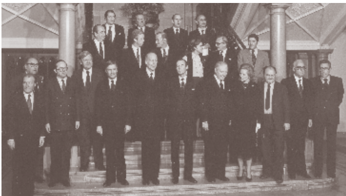
Photo de famille du dernier Conseil européen réunissant les chefs d'État ou de gouvernement des Neuf, ainsi que le président de la Commission, tenu à Luxembourg les 1 et 2 décembre 1980.

Le CVCE mène actuellement un vaste projet consacré à l'œuvre et à la pensée européennes de Pierre Werner, basé principalement sur l'exploitation intensive des archives familiales Werner, ouvertes pour la première fois à des fins de recherche.