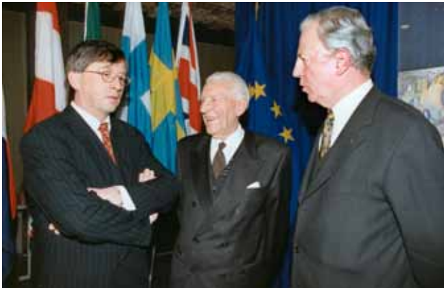
Pierre Werner, entouré de Jean-Claude Juncker, Premier ministre luxembourgeois, et de Jacques Santer, président de la Commission européenne, à Luxembourg le soir du 31 décembre 1998, veille de la naissance de l'euro